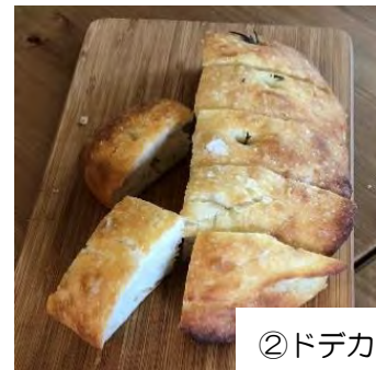
② ドデカフォカッチャ

★パン教室に保護者の方と一緒に参加されるお子さん以外の、ごきょうだいの保育は行っていませんので、ご家庭内でご相談の上、お申し込み頂くようお願い致します。