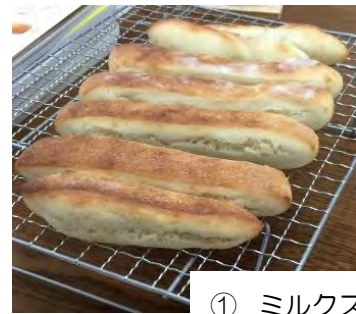
① ミルクスティックパン